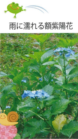
雨に濡れる額紫陽花

近畿が梅雨入りした6月10日、裏の竹やぶに見事な額紫陽花（がくあじさい）が咲いています。事務所の前のカウンスターにも立派な紫陽花が咲き誇っています。