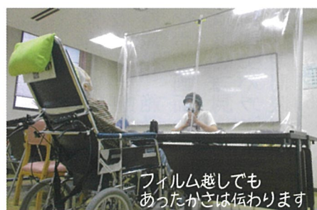
フィルム越しでもあたたかさは伝わります