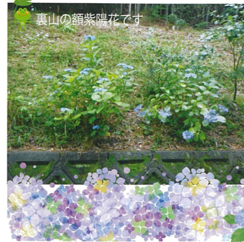
裏山の額紫陽花です