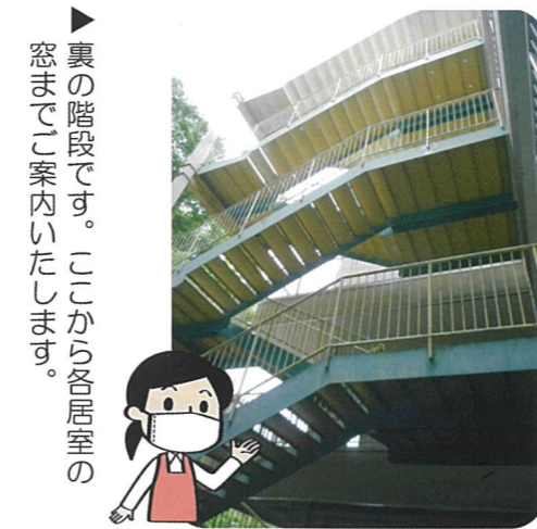
裏の階段です。ここから各居室の窓までご案内いたします。

現在スローライフ千里では、新型コロナウイルス感染防止の観点からご入居されている方の面会を制限させていただいている状況です。 面会いただく場合は裏階段を使用し、居室の窓越しで電話でお話し頂く面会、テラス面会をお願いしておりますが、家族様より『ご本人の様子をご家族のスマートフォンで撮影して欲しい』などのご希望なども聞かれます。 なるべく家族様の思いに叶えられるように努力して行きたいと思っておりますので、お気軽にご相談頂ければと思います。 色々ご不自由をおかけいたしますが、出来る限り早い制限解除に向けて努力していきますので、ご協力の程宜しくお願い致します。