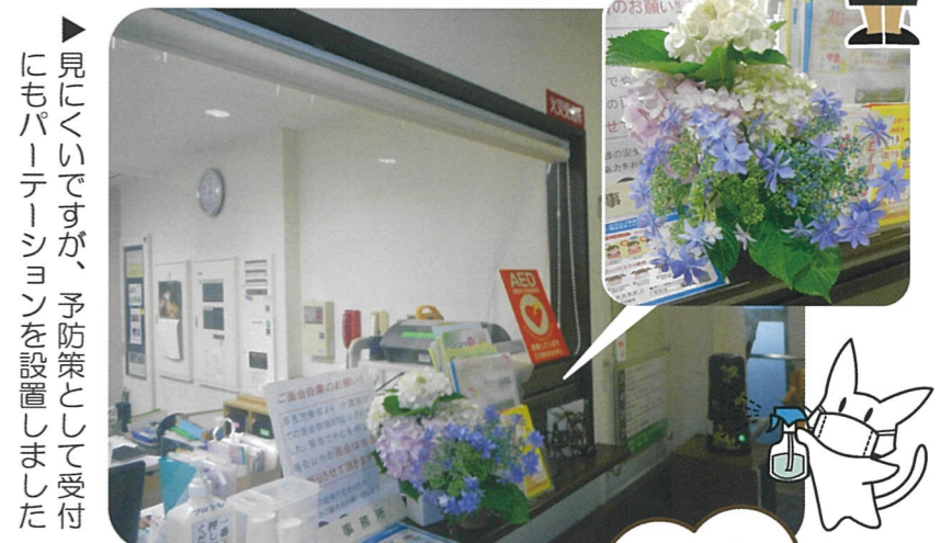
見にくいですが、予防策として受付にもパーテーションを設置しました