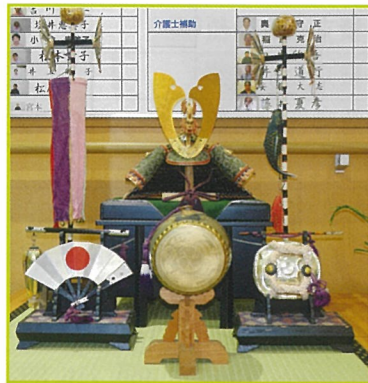
5月 兜も飾られました