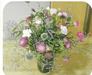
かわいいカーネーション

トが明治末期に、また、大正4年には教会でお祝いの行事が開かれるようになり徐々に世間に広まり、今では、母の日にカーネーションを贈る日として定着していますよね。 私達も労りと感謝の気持ちを忘れずに利用者様と接して行きたいと思えます。 最後にコロナウイルスはなくなった訳ではないので、利用者様、私達も第二波、三波に見舞われないように引き続き気を付けていきたいと思います。