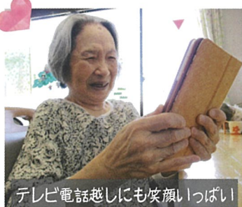
テレビ電話越しにも笑顔いっぱい!

なおタブレットでの会話は予約なしでご利用いただけます。来所時に事務所までお声かけください。