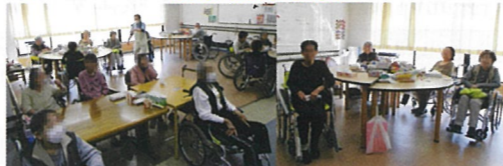
🐱 みなさま、おかわりなくゆったりくつろがれておられました