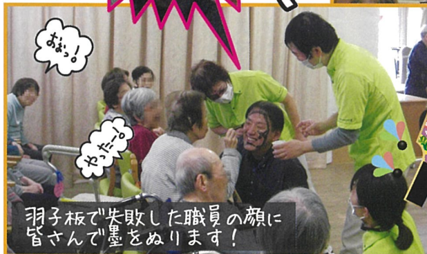
羽子板で失敗した職員の顔に皆さんで墨をぬります！