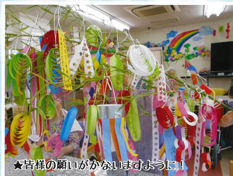
★皆様の願いがかないますように!