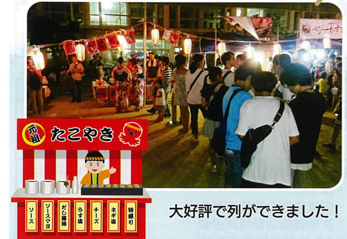
大好評で列ができました!

夏です。暑い毎日が続きます。 スローライフ千里では毎年恒例と なっている地元藤白台の夏祭りに 参加しました。8月2日、8月3 日と、これも恒例の「たこ焼き」で の出店となりました。 昨年は電 源トラブル等で焼きあがりになら ないの時間がかかり来て頂いた方に、 お待ち頂く事となってしまいまし たが、今年はトラブルもなく待ち 時間も少なく提供できました。