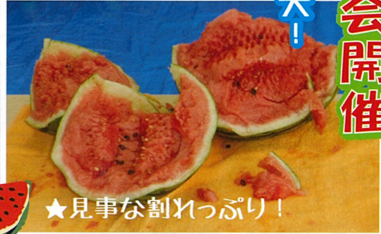
★見事な割れっぷり!

今年も恒例のスイカ割り大会 がありました。「美味しそうに、 割ってくださいね。」の掛け声で 始まり、入居者様お一人ずつ、 目隠しして「こん棒」をスイカ めがけて振り下ろされ見事な割 れ方をしました。