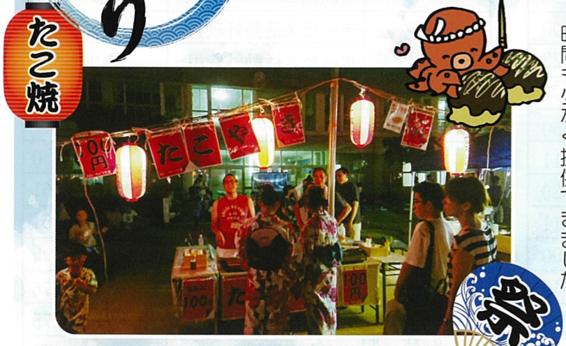
たこ焼きがおいしい!と、うれしい忙しさ!