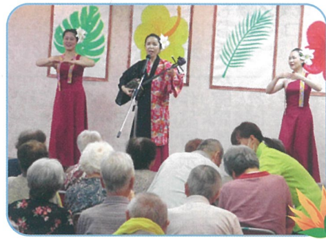
ハワイと沖縄の音楽には共通点がある気がします