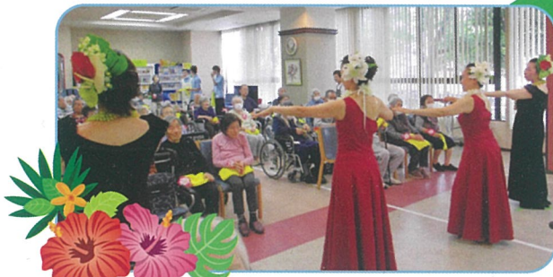
うっとりとおぼれてしまいます

今年もまたカラフルな衣装を身にまとった麗しきみな様がスローライフ八尾にお越しくださいました。回数を重ねるごとに新たな魅力を見せていただけるスタジオ・ナニアロハのみなさん。ゆったりとした音楽からアップテンポの曲まで、たくさんのお踊りを披露してくれました。またウクレレと三線の伴奏でBIGGINの歌も演奏。歌を知っている利用者様や職員も一緒に口ずさみました。