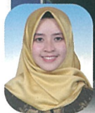
後日ノニさんが来日

インドネシアの人々は、日本人に近い気質をもっています。幅広い世代が共に生活をする中で育った方が多く、小さな子の面倒を見て、高齢者を敬い、思いやりを持って人と接することが日常です。来日された7名も明るく率直で面倒見がよく、希望に満ちて学んでいます。すでに見かけられた、ご家族様も多いと思います。ご利用者様、ご家族様と近づけることを皆が願っています。どうぞ声をかけ話をして下さい。