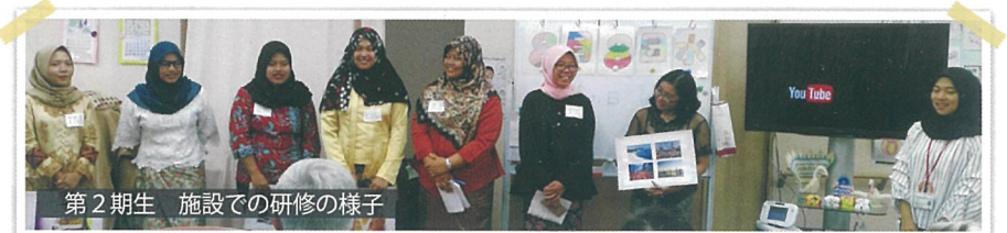
第2期生 施設での研修の様子

和貴会本社 〒581-0003 大阪府八尾市本町2丁目8番3号オパール本町ビル3階 TEL: 072-920-2212 FAX: 072-920-2213