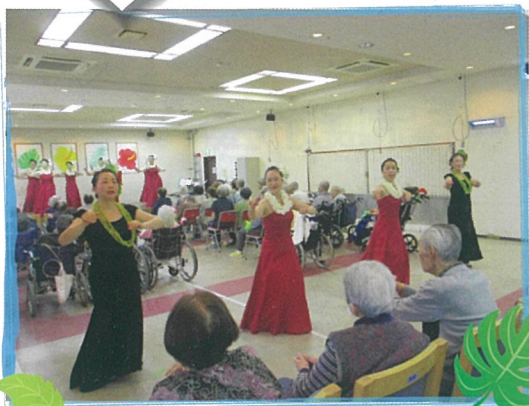
艶やかな衣装と、繊細な踊り

今年もまたカラフルな衣装を身にまとった麗しきみな様がスローライフ八尾にお越しくださいました。回数を重ねるごとに新たな魅力を見せていただけるスタジオ・ナニアロハのみなさん。ゆったりとした音楽からアップテンポの曲まで、たくさんのお踊りを披露してくれました。またウクレレと三線の伴奏でBIGGINの歌も演奏。歌を知っている利用者様や職員も一緒に口ずさみました。