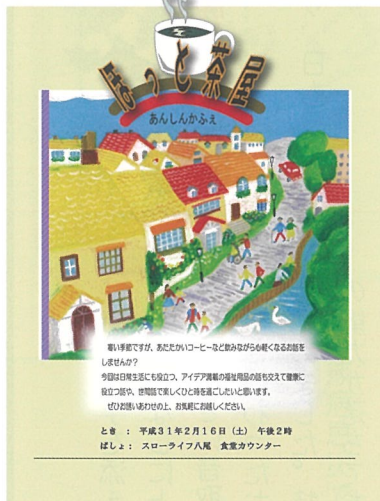
お問い合わせ：介護老人保健施設 スローライフ八尾 八尾市福栄町1-12 電話：072-990-0100