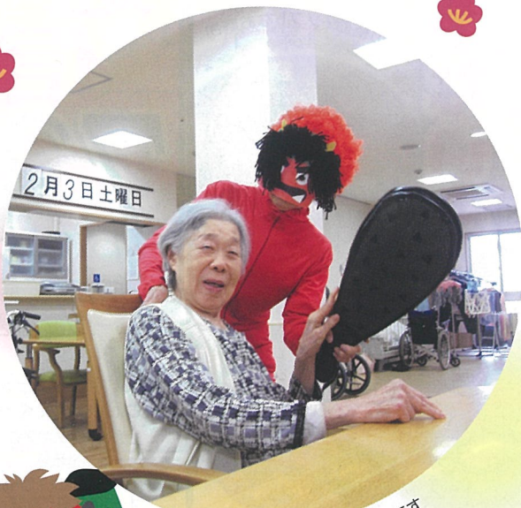
グループホームでの節分の様子です

また今年にはフロアからの出し物以外にお手製の獅子舞も登場し、例年にもましての盛り上がりを見せました。