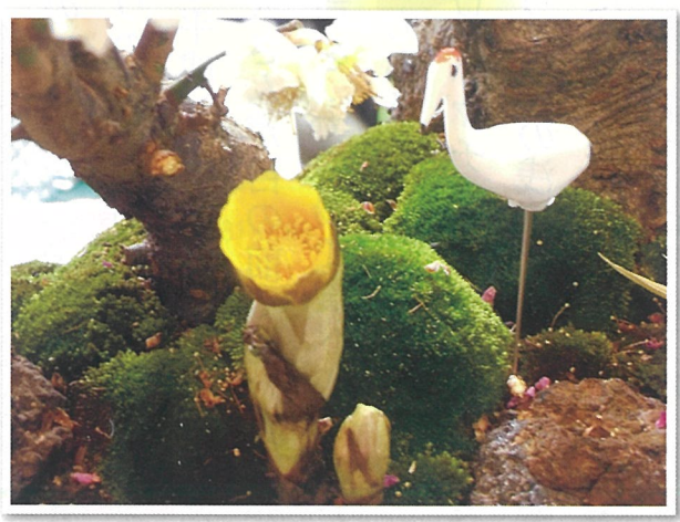
今年にはカウンターへの盆栽の福寿草が咲きました