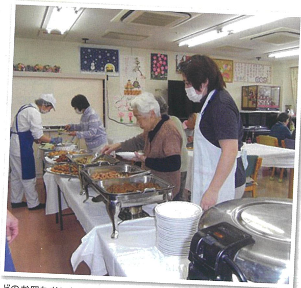
どのお皿もおいしいそうですね♪

普段、食事形態がキザミやミキサーの方もこの日はやはり、好きな物にチャレンジする方も…。スタッフも驚くほど嚙下の問題なく召し上がりていたり、ここぞとばかりにおかわりをされる方など…。皆さん