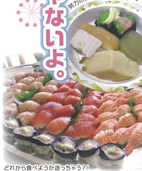
どれから食べようか迷っちゃう？！