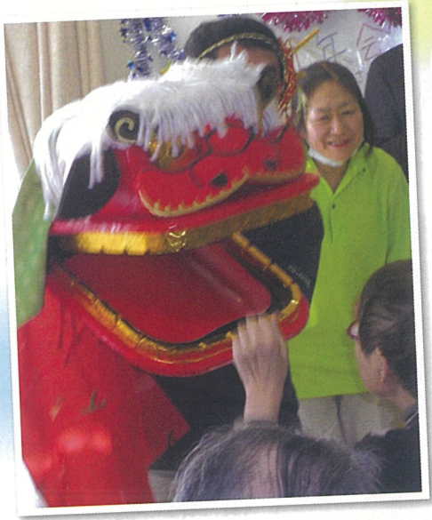
獅子が頭を噛みに来ました