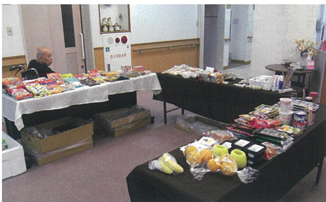
周りにお店が少ないので大助かりな訪問販売

ないし…」という声（気持ち）がありました。ちょうどそんな時、訪問販売の営業がきたのでお願いすることにしました。パンやお菓子といった食べ物や飲み物、日用生活雑貨や衣類までラインナップはなかなかのものでした。まだまだ規模的には小さいものの、結果的には皆さんに喜んでもらえたのではないのでしょうか。また、希望する商品は次回に持ってきて頂けたりと嬉しいサービスです。