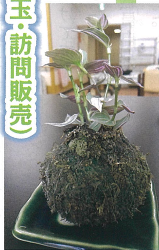
立派なこけ玉が完成しました