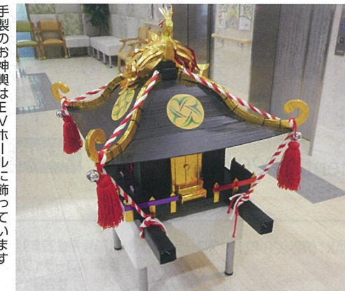
手製のお神輿はEVホールに飾っています

は暑さで体調を崩される方も居られたこともあり、今回の変更となりましたが、内容は盆踊りや屋台、吹田市のイメージキャラクターの参加も例年の夏祭りと変わりません。 では何が違うかというと、開催時間が14時～16時と日中の開催となりました。この事でデイサービスなど通いで来られている方も参加が可能になり更に賑やかな催しになると思われまます。また今年は新しいボランティアの方の参加や、お手製のお神輿の登場といった新しい企画もあります。