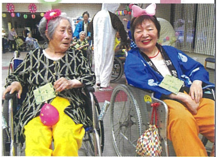
はしゃぐときは少女のように

は異常だ」。近頃毎年口にしてこの言葉ですが、今年の暑さは異常なほどです。そんな暑さ真つ盛りの8月初旬に入所者様、そして残暑が厳しい下旬にはデイケア利用者様と2度(3日間)に分けてスローライフ八尾の「納涼祭」が行なわれました。