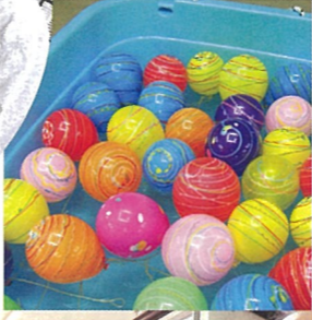
カラフルなヨーヨー

職員の手づくりイベントで、この日に向けてアイデアから当日の準備まで、「あーでもない、こーでもない」と職員自身も楽しみながら企画しました。↑