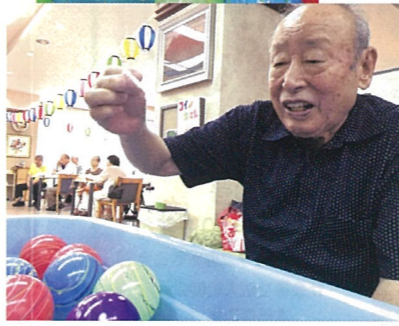
きれいなヨーヨーを狙って

「俺の後ろに立っな？」 入所利用者様は夜祭で、ファイナレは噴水花火の繚乱。夜空に大輪とはいきませんでした、次々と噴出す色とりどりの花火にうっとりで見入っていました。