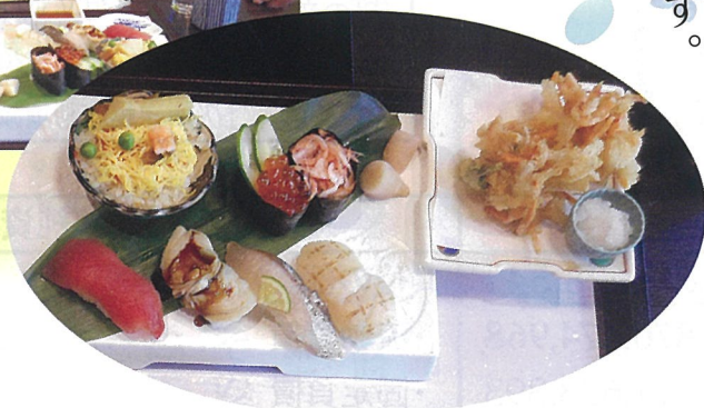
「握り寿司と小さな麺セット」