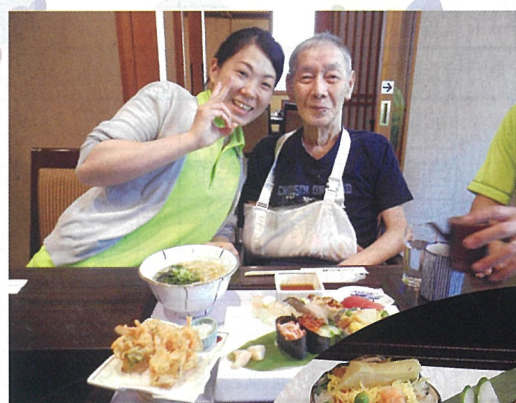
食事の前に「ハイ、チーズ」

ではバラ園に、グループホームではおやつにクレープを作るなどのレクを行っています。