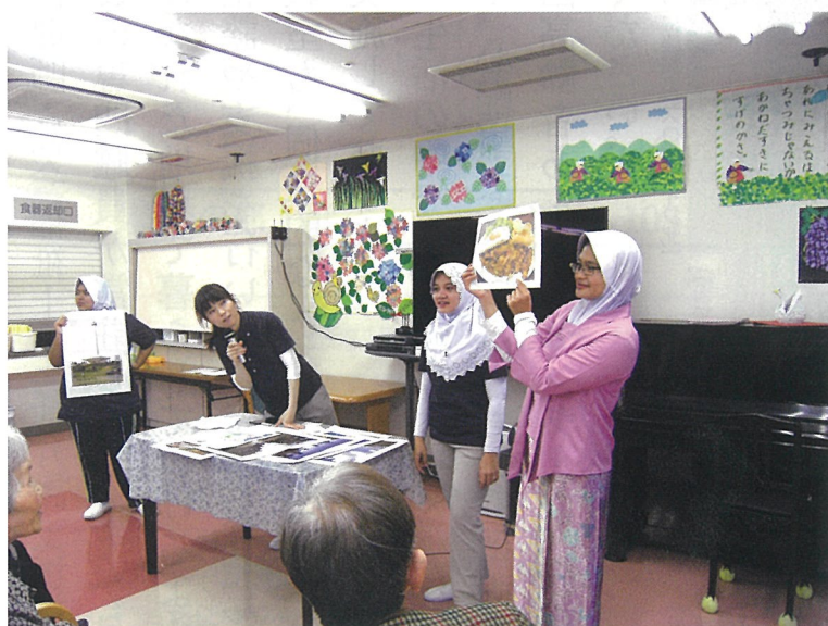
母国の文化や料理を紹介してもらいました

5月の誕生日会では、ボランティアの方が来られず良い機会だったこともあり、留学生3名で、インドネシアについて発表会を行いました。入居者の皆さんの前で民族衣装のケバヤを披露してくれ、文化や食べ物、観光地の紹介があり、唄を歌ってくれて、たっぷりインドネシアを堪能させていただきました。入居者の皆さんも微笑ましくご覧になられていました。異文化交流ってなかなか体験できないので、入居者様にとっても職員にとっても良い経験になり、またさらにより良い施設になっていければなあと思いました。