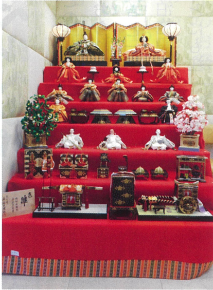
毎年恒例のひな飾り