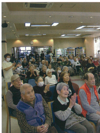
ボランティアの皆さん ありがとうございます。

八尾市赤十字奉仕団婦人部、日本赤十字社大阪府支部芸能奉仕団、そして事務局(八尾市市民ふれあい課)の皆さま、本当にありがとうございました！