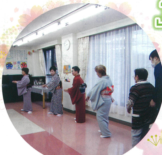
皆さん素敵な踊りをありがとうございました!

2月に入ると、桃の節句「雛人形」の準備です。毎年、「これはどこやる…」「こっちはじゃないの…」と小物に苦戦したり、三人官女の位置が分かり辛かったりするので、タブレットで雛飾りの画像を拡大しながら飾り付けをしていると、「最近では便利になったなあ」と驚かれています。ついでに、雛人形について検索!