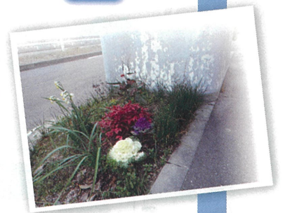
モノレールの橋脚沿いの葉牡丹