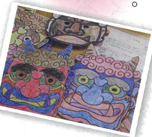
豆まきの時の手作りのお面