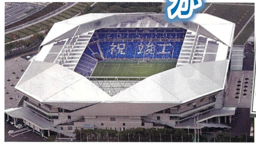
新スタジアムお披露時上空からの写真