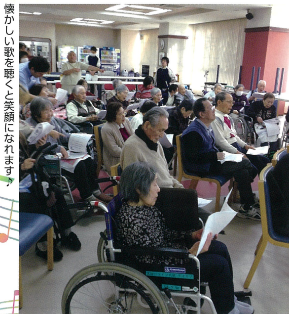
懐かしい歌を聴くと笑顔になります。