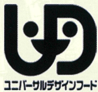
ユニバーサルデザインフード

最近ではスーパ等でも見かけるようになりま したが、製品に食べやすさの段階に応じて、「区分1」 や「区分2」といったマークで種類分けがなされてい るものがあります。これは日本介護食協会が制定し た規格に適合した食品を表して、このように食 べやすさに配慮されたものを「ユニバーサルデザイン フード」と呼びます。(適応している食品のパッケージ に必ず下記のマークがついています。) 冷凍やレトルト調理加工食品等多く の種類があり、硬さや粘度の程度に よって次の4つに分類されます。