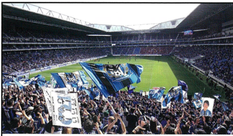
スタジアムグルメも気になります。

スローライフ千里では交通渋滞を懸念していましたが、やはり試合前後はスタジアム前の外周道路が3車線とも渋滞していました… 時間帯によっては送迎にもかかわるので、誘導スタッフの配置や外周道路に出てくる車を制限するなどの渋滞緩和対策をしてもらいたいと感じました。