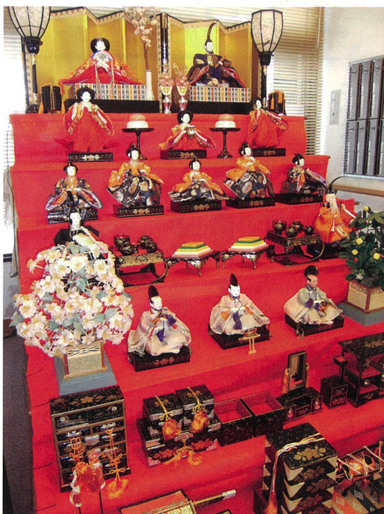
玄関横に飾り付けさせて頂いています。

部品も欠損していたりと、今回の申し出はちょうど良い機会だったのかもしれない。古い雛壇飾りも長年ご苦労様でした。新たな雛壇飾りは定位置の玄関横に飾り付けさせて頂きました。親王・三人官女・五人囃子・隨身（ずいじん）・仕丁（じちょう）と新たに皆さんの邪気を払って下さいますようお願いいたします。