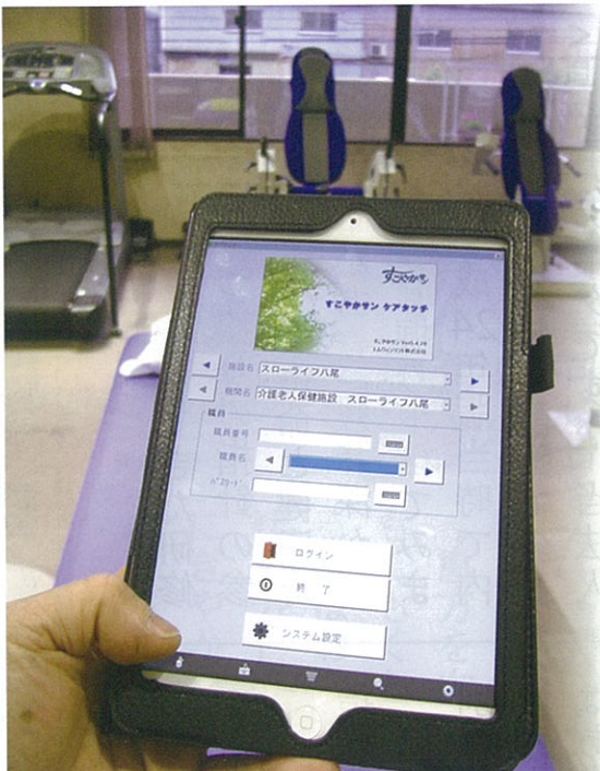
タブレット端末を活用していきます

を使った電子カルテが増え、きています。が、「スローライフ八尾」ではこれまで、そのカルテはほぼ全て手書きで記載して