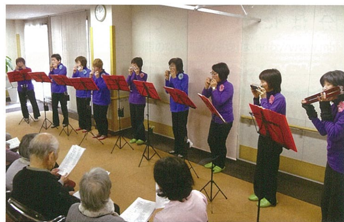
ボランティアの皆さん、ありがとうございました!

ハーモニカと重厚感は音に陶酔してしまうほどでした。11曲演奏して頂きましたが、皆さんうっとり聞き惚れていました。私的には「宇宙戦艦ヤマト」がよかったですね:年代でしょうか(笑)是非ともまた来て頂きたいものです。「ハーモニカ」の皆様、本当にありがとうございました。