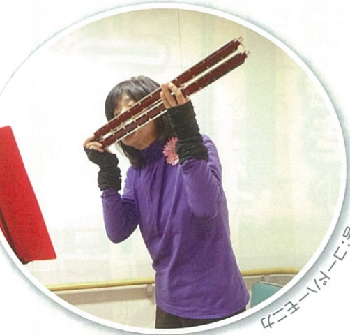
特:ベースハーモニカ

他にも色々あるので、説明はこれくらいにして、肝心の内容ですが、これがまたすごい!ハーモニカと侮っていませんでした。アーティストが演奏しているハーモニカは聞いたことはあったものの、まるで別次元。その