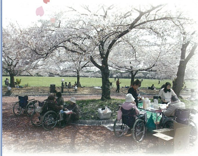
満開の桜に春を実感しますね♪