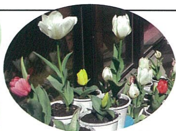
キレイに咲いてくれました！

人権教育の一環で一生懸命育てたチューリップを、花が咲く前にプレゼントしてくれました。一鉢ずつ大事そうに抱えてきた子供