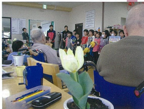
上島小学校の皆さん、ありがとうございました！

たちが、デイケア利用者様に笑顔と共に手渡します。会話も盛り上がり、受け取る利用者様も