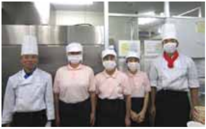
これからもいろいろと工夫していきます。

材料も分らないものが多く、見ただけで食欲がなくなる方もいらつしゃいます。ゼリー食」はその食材に合わせた形に加工できます。