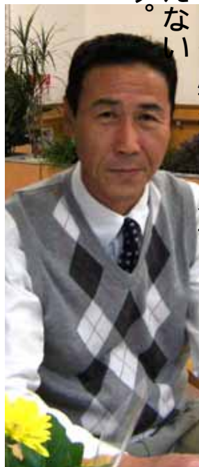
スローライフ生駒