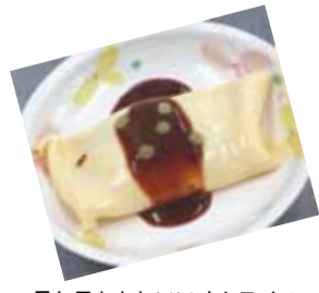
見た目もかわいいオムライス

また家族様他におかれましては、風邪症状の際には面会を控えていただくなど、感染予防にご協力いただきますようお願い致します。