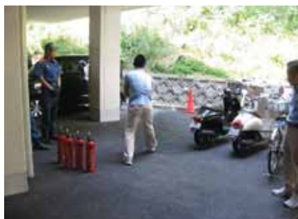
訓練用の消火器を実際に使ってみる

消火訓練、避難訓練、通報訓練を行い、普段あまり触れる機会のない消火器を実際に使ってみるなど、万が一に備えて真剣に取り組みました。今後は施設として、訓練をすることで見えてきた避難誘導の円滑化といった課題にも取り組んでいきたいと思ひます。