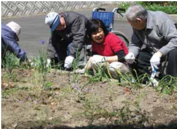
美化活動も楽しみながら

みなさんは「ア ドプトロードプ ログラム」とい うものをご存知 ですか？これは、 企業や自治体、 住民がみんなで 協力して公共の 場所をきれいに しようという取 り組みで、この 4月から、「スロ ーライフ千里」 でも町の美化に