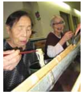
食感も楽しい流しそうめん