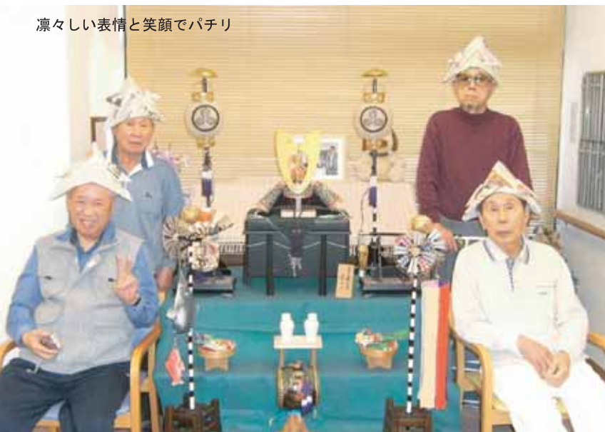
凛々しい表情と笑顔でパチリ

お琴の音色に合わせて口ずさんだり、手や体を音楽に乗せて動かしていました。みんなで一体感を感じました。