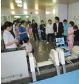
安全使用に向けた職員研修