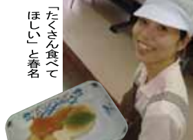
「カレーのみぞれ煮」のソフト食