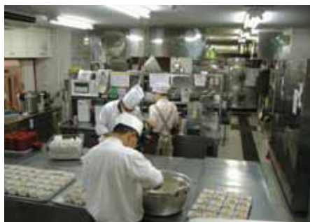
忙しく立ち働く厨房スタッフ