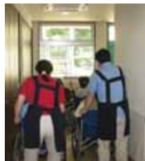
後姿も真剣な表情

八尾 ○納涼祭 8月22日(日) 今年もスローライフ八尾駐車場にて「納涼祭」を開催します。楽しい催しを企画中です。みなさんお越し下さい。