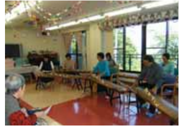
生駒山にこだまする(?) 琴の調べ