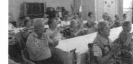
練習の成果をみんなで披露