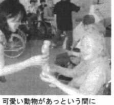
可愛い動物があったという間に

「ケアハウス スローライフ生駒」は生駒山の中腹に位置しています。居室や食堂からは生駒市内はもとろんのこと、奈良市内までも見渡すことができ、自然に囲まれた緑豊かな地域にあります。 施設の種別としてはケアハウスにあたり、1人部屋が24室、2人部屋が3室で、合計30名の入居者様が生活されています。 共に生きる喜びを感じられる施設 ケアハウス スローライフ生駒 ケアハウスは、障がい・住み取りに近しい軽費老人ホームです。心身状況に応じた「在宅」と同様に「在宅」に近い生活が受けられ、生活の維持が図られます。