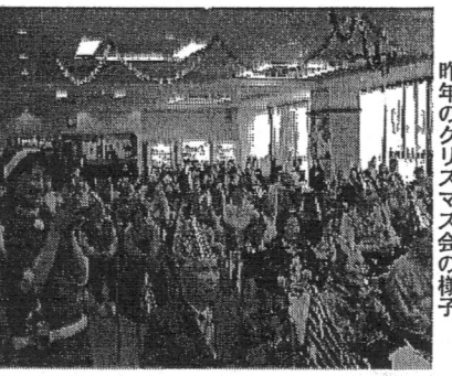
昨年のクリスマス会の様子

昨年7月に納涼祭、12月にクリスマス会を行いました。多数のご家族様に参加していただき、なんとか成功を収めることが出来ました。毎月の誕生日会ではゲームやプレゼント進呈等を行い、ご利用者様に喜んで頂いています。昨年は開所して間もない時期で十分な準備が出来ず、今年はいきたいと考えております。ご家族様のご協力をお願いいたします。