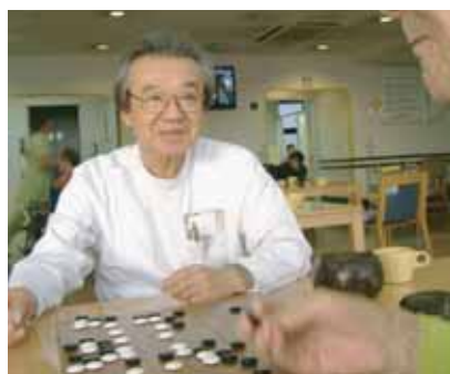
多忙の中で時間を見つけて入所者様と一局

今年も老健の中間施設としての意義を一段と高め、地域展開をはじめ、他施設連携のネットワークを強化