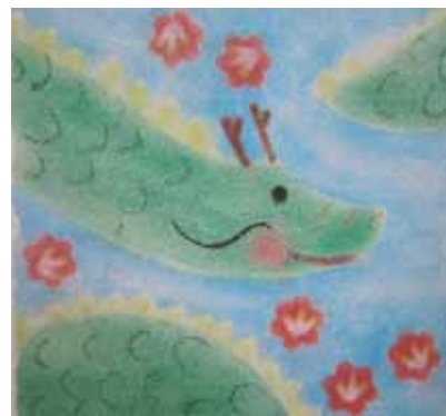
Illustration: 小川一美(なごみアート)