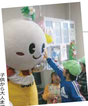
子供から大人まで 大人気の「すいたん」