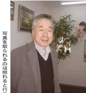
写真を取られるのは照れると行本

頂きました。備えあれば憂いなし。介護職の離職率の高さは指摘され久しいのですが、やはり、一人ひとりの利用者様を大切にしたいという思いと技術を蓄え、誇りを持ち安心して仕事に携われる職場にすることがスタッフの定着に、そして何よりも利用者様の安心された生活に欠か