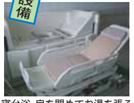
寝台浴。扉を開けてお湯を張る

今回は施設見学でも、使用中などでなかなかご覧頂けない入浴設備について紹介したいと思います。