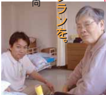
入所者様とお話中にパチリ

この職種は利用者本人様はもちろん、その家族様や関係機関との関わりが大きく、日々緊張の日々を送っています。本当の意