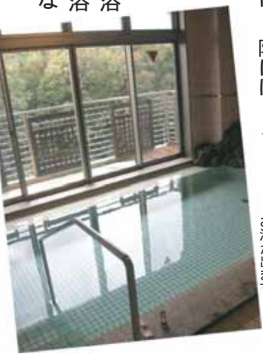
展望浴岩のころからお湯が出ます。

方はこちらを使用して下さい。もう一つは、3階の物とは少し形状の異なる座浴写真右のパンジー。