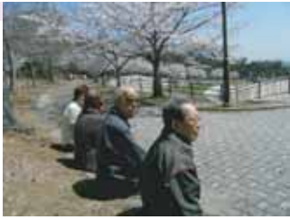
やさしい風が気持ちいい季節