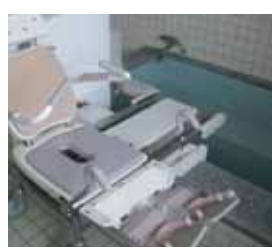
横にスライドする座浴

スロライフ千里には色々な形態の入浴設備があります。まず2階、4階には、自宅のお風呂のように、一人でゆったりと入浴を楽しめる一般浴を二つずつ設置しています。