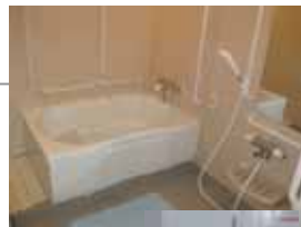
2階、4階の一般浴(上)と、パンジーと呼ばれる座浴(右)。

今回は施設見学でも、使用中などでなかなかご覧頂けない入浴設備について紹介したいと思います。