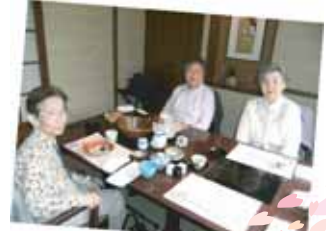
楽しい気分で、つい食べ過ぎる？