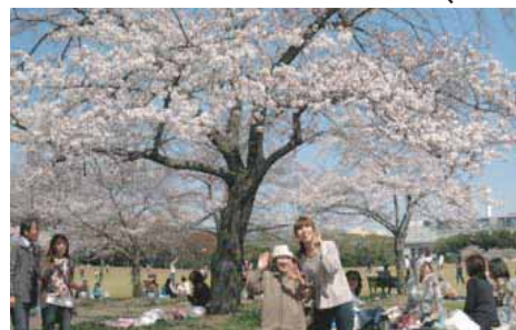
満開の桜の下でみんな笑顔に