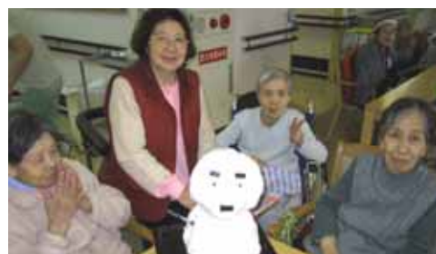
ちょっとした季節の贈り物

に染めていたのです。コーフンした職員が、朝一番から雪だるまを作って、利用者様のところに届けました。