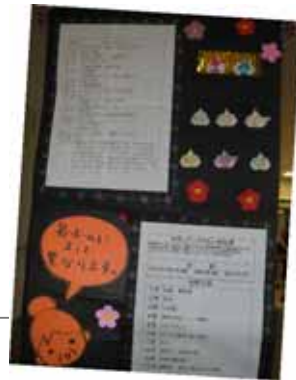
施設内でのスケジュールなどをかわいく紹介。グループホーム

用実績を、月毎に市町村の窓口へ提出します。この流れを毎月繰り返していきます。施設でのケアプランは、その施設のケアマネジャーがプランを作成する形になります。認定を受け、作成されたケアプランに基づきサービスを利用する、これが介護保険サービスを利用する一連の流れとなります。