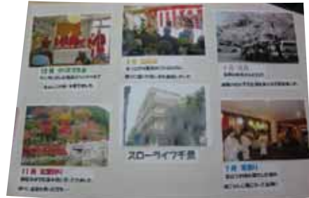
これまでの実績や建物などを紹介した特別養護老人ホームの作品

吹田市役所にて 『介護フェア』 去る2月21日~25日の5日間、吹田市役所で恒例の『介護フェア』が行われました。 スローライフ千里からも特養部会と