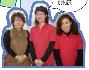
私たちが真心こめてカットします。