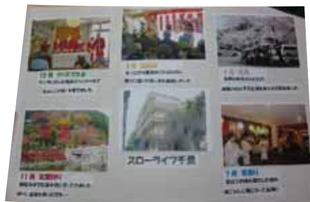
これまでの実績や建物などを紹介した特別養護老人ホームの作品

吹田市役所にて「介護フェア」 去る2月21日〜25日の5日間、吹田市役所で恒例の「介護フェア」が行われました。スローライフ千里からも特養部会とグ