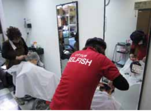
おしゃべりなど、楽しいひと時でもあります