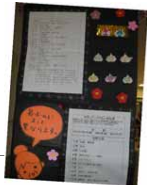
施設内でのスケジュールなどをわかりやすく紹介。グループホーム

日に展示を行いました。 展示当日は参加施設の担当者が輪番で受付を務め、スローライフ千里からも担当者を出させてもらいました(慣れない事もあり、つたない案内し