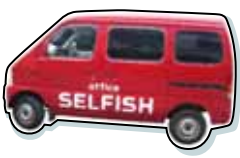
まっ赤な車でやって来る!