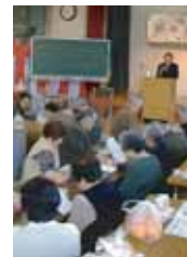
会場一杯の参加者

予防や運動の重要性など、多岐にわたる内容を、身近な話題を交えて楽しくお話をしました。