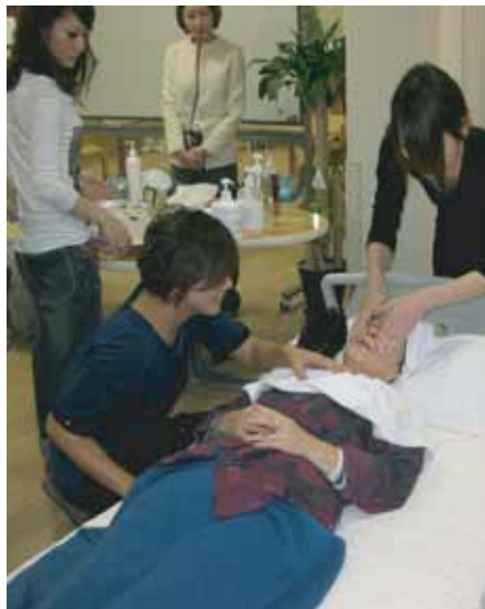
どんどん美しくなる...

私はいま、入所・シ ョートステイなどの ご利用者と関わる事 で、自分自身が成長さ せてもらっている、心 の底から痛感してい ます。 ここスローライフ 八尾」で働き始めて丸 3年になりました。常 に「介護者の主観を押し