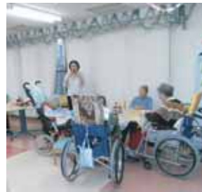
お腹から声を出して