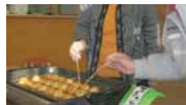
つい手が出るんですよ

おしゃべりはずむ たこ焼きパーティー 2月7日は小規模 多機能型居宅の「通 い」でたこ焼きパ ーティー。みなさん、 熱いたこ焼きをハ フハフ 言いな がら、 ほおば つてお られま した。