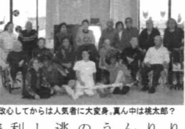
改心してからは人気者に大変身、真ん中は桃太郎?

和気あいあいと、にこやかに過ごしていた利用者様を恐怖におとし入れたのでした。おとしれたか見えません。ところがデイケアの利用者様は、河内の「おっちゃん」「おばちゃん」として、いくつもの難関を乗り越えて来られたつわもの揃い。そこいら辺の鬼には負けません。ちょうど節分という事もあって、用意していた「新聞紙製豆弾」と新聞紙製迷刀野口守利宗を携えて果敢に立ち向かっていきます。