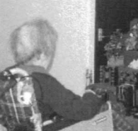
手のつけられない暴れん坊青鬼

スローライフ八尾 昔々といっても少し前の事でした。大阪の河内の村々で、もっぱら男を好んで食らう赤鬼と、女を好んで食らう青鬼が暴れまわり、村の人々を困らせていました。 そんな、げに恐ろしい赤鬼と青鬼が、なんとというこ