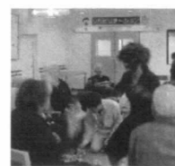
音楽に合わせてリズムよく踊ります。

みんなでダンス! 1月25日には、お誕生日会をかねて「車イスダンス『フレンズピア』」のみな様に来て下さいました。 3回目の来訪とあって、入居者のみな様も少しずつ要領を得ています。 パートナーをチェン 音楽に合わせてリズムよく踊ります。