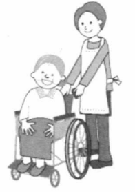
利用者様は、よりお知れたいと思いますが、ここで大まかに説明いたします。