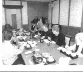
いつも通った雰囲気、美味しい食事を楽しめました。

これからも入居者様の楽しいような笑顔を見せていただけるように、機会を作っていきたいと思えます。