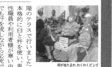
何が当たるか、わくわくビンゴ

「影を慕い」など往年の名曲を次々と披露してくれました。会場では皆さん手拍子で盛り上がり、昔を思い出して涙する方もおられました。