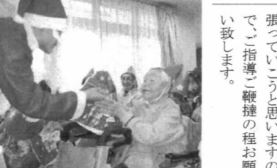
サンタが千里にやってきました