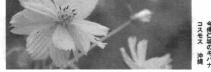
命懸けのキバナコスモス 沖浦

スロウライフ共助 〒630-0266 奈良県生駒市門前町8番33号 電話：0743-75-1525 FAX：0743-75-1501 特定施設入居者生活介護（ケアハウス） スロウライフ八尾 〒581-0844 大阪府八尾市福栄町1丁目12番地 電話：072-990-0100 FAX：072-990-0022 介護老人福祉施設（老人ホーム）・認知症対応型共同生活介護（グループホーム） 介護老人保健施設・短期入所療養介護（ショートステイ）・通所リハビリ（デイケア） 居宅介護支援事業 スロウライフ千里 〒565-0826 大阪府吹田市千里万博公園6番8号 電話：06-6816-1100 FAX：06-6816-1110 介護老人福祉施設（老人ホーム）・認知症対応型共同生活介護（グループホーム） 小規模多機能型居宅介護・認知症対応型通所介護（デイサービス） 短期入所生活介護（ショートステイ）