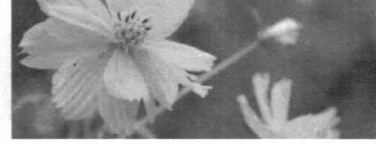
命懸けの花キバナコスモス 沖浦

スロウライフ共助 〒630-0266 奈良県生駒市門前町8番33号 電話：0743-75-1525 FAX：0743-75-1501 特定施設入居者生活介護（ケアハウス） スロウライフ八尾 〒581-0844 大阪府八尾市福栄町1丁目12番地 電話：072-990-0100 FAX：072-990-0022 介護老人福祉施設・短期入所療養介護（ショートステイ）・通所リハビリ（デイケア）・居宅介護支援事業 スロウライフ千里 〒565-0826 大阪府吹田市千里万博公園6番8号 電話：06-6816-1100 FAX：06-6816-1110 介護老人福祉施設入居者生活介護（特別介護老人ホーム）・認知症対応型共同生活介護（グループホーム）・小規模多機能型居宅介護・認知症対応型通所介護（デイサービス）・認知症対応型訪問介護・短期入所生活介護（ショートステイ）