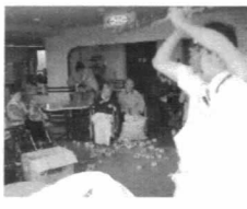
暴れまわる鬼をみんなで退治!

職員手作りの豆(新聞紙製)をちよつと怪しい鬼に向かって投げつけ、皆さん楽しそうに厄をはらいました。今年もよい年になりそうです。