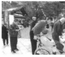
すがすがしく新たな決意を

職員手作りの豆(新聞紙製)をちよつと怪しい鬼に向かって投げつけ、皆さん楽しんで厄をはらいました。今年もよい年になりそうです。 新聞やテレビ等で報道されている冷凍食品について、ご家族様も心配やご配慮されていることと 現行の「老人保健制度」が「後期高齢者医療制度」に 後期高齢者医療制度が始まります 平成20年4月スタート 病院などにかかった際に、健康保険のほか、「老人保健制度」を利用されている方も多いと思われていますが、本年4月よりその「老人保健制度」が「後期高齢者医療制度」に変わります。 現在、「老人保健制度」で医療を受けていた皆さんは基本的にそのまま「後期高齢者医療制度」で医療を受けることとなります。 ○受診時 医療機関を受診した際、かかった費用の1割(現役並み所得者は3割)を医療機関の窓口で支払うこととなります(現行の「老人保健」と同様)。 またこれまでと同様、入院時食事療養費、保険外併用療養費などといった給付も受けられます。 ○保険料 保険料については、一人ひとりが等しく負担する均等割額(応益分)と、 存じます。 当施設におきまして、該当商品は勿論、中国産の肉についても使用して供に努めてまいります。 おりませんのでご安心下さい。 今後も安全な食事の提供に努めてまいります。