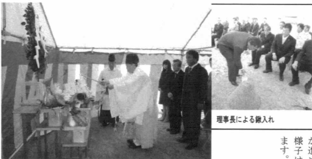
理事長による鎮入れ

見守る中、奈良・手向山八幡宮の上司延訓宮司により、肅々と神事を行い、工事の安全を祈願しました。本年秋のオープンに向けて着実に、安全に工事が進められます。工事の様子はこの通信で紹介いたします。