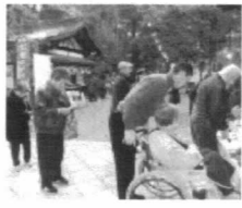
すがすがしく新たな決意を

1月6日、8名の入居者様と往馬大社(生駒神社)へ初詣にでかけました。寒い日でしたが、お参りの後お守りを買われたり、おみくじを引かれたり。スローライフ生駒最高齢97歳の方も元氣にお参りされ、干支のねずみの置物を、干支に選んでおられました。すがすがしい気持ちになるねえ、また来年もこうね」と神社を後にしました。