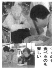
つくのも食べるのも楽しい

1月15日、新春の大もちつき大会が行われました。デイケアサービスの利用者様にご指導いただき、職員によりつきはじめましたが、あつという間に息切れ。あとは利用者様、また入所されている方々が積極的に参加され、次々とおいしそうなもち