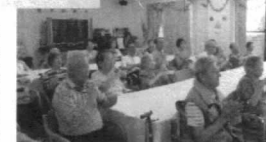
練習の成果をみんなで披露

ました。当日は、多少の間違ひはあったものの、皆で歌いながら、手話で表現することの素晴らしさに感激しました。その後の音楽療法を取り入れたレクリエーションも盛大に盛り上がりました。