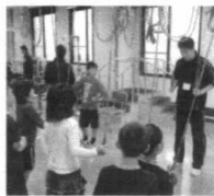
リハビリ室では楽しく汗をかいた

リハビリ室では、初めて見る様々な器具や装置を実際に体験。車椅子に乗ったものの行き方、方向へ行けない子ども、真剣に筋力向上の装置に挑戦する子どもなど、汗をかきつつ、興味を持って積極的に取り組んでいました。