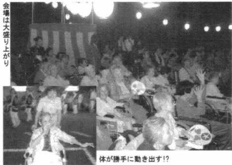
体が勝手に動き出す!?

ない食べ物やビール等もあり、皆さん楽しんで頂けたと思います。駐車場では、くじ引き、金魚すくい、ヨーヨー釣りを行いました。利用者様に夏祭りの雰囲気を楽しんでいただける様に、職員一同みんなで工夫を凝らしました。出店を一通り楽しんで頂いた後は、皆さん駐車場にごら組んでの盆踊り大会、輪の中に入って踊る方や、手拍子される方、皆さん笑顔で楽