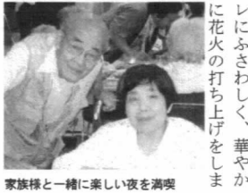
家族様と一緒に楽しい夜を満喫

しまして最後はフィナーレにふさわしく、華やかに花火の打ち上げをしました。家族様と一緒に楽しい夜を満喫