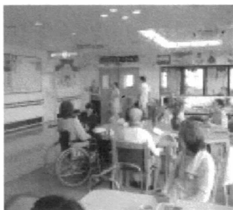
いつも笑いの絶えないフロア

も色々な工夫をして賑やかにしています。普段とはちよつと違つた日常で、自然体の中にも和気あいあいと刺激を受け合える……。 人生の大先輩であるご利用者の皆様が、一日いちにちを充実して過ごしていただけるよう、またご家族の皆様方が気軽に足をお運びいただけるよう、開かれたデイケア、サービスを目指しております。