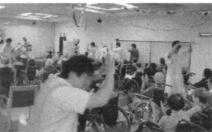
にぎやかに盛り上がった阿波踊り

も色々な工夫をして賑やかにしています。普段とはちよつと違つた日常で、自然体の中にも和気あいあいと刺激を受け合える……。 人生の大先輩であるご利用者の皆様が、一日いちにちを充実して過ごしていただけるよう、またご家族の皆様方が気軽に足をお運びいただけるよう、開かれたデイケア、サービスを目指しております。