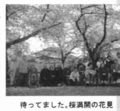
待つてました。桜満開の花見

日帰りで施設にお越しいただき、リハビリをはじめレクリエーションや入浴、食事などで一日を過ごすデイケアサービス。