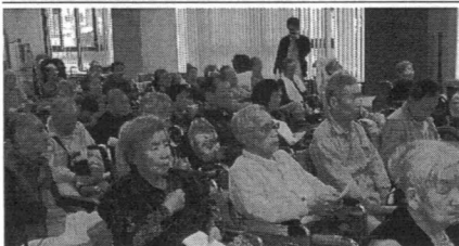
入所者様みんな誕生祝い

本の歴史を交えた楽しいお話をしていたり、お誕生日を迎えられた方々、入所者様みなさんでお祝いし、和気あいあいとした催しとなりました。 誕生日を迎えられたみなさま、本当におめでとございます。